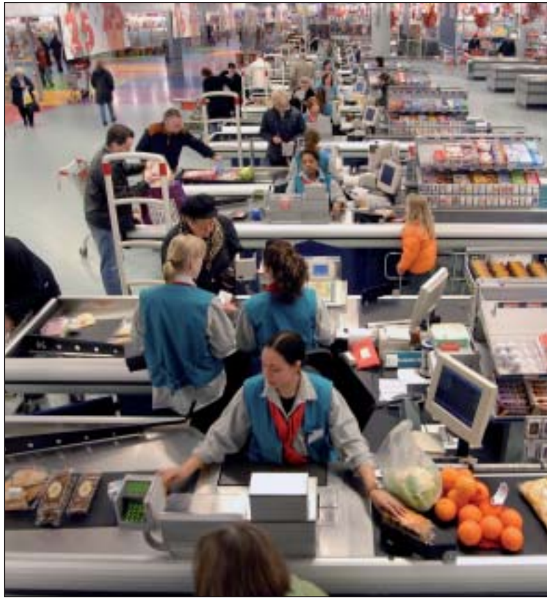
De prijzen waren bijna 6 procent hoger, het volume nam bijna 7 procent toe