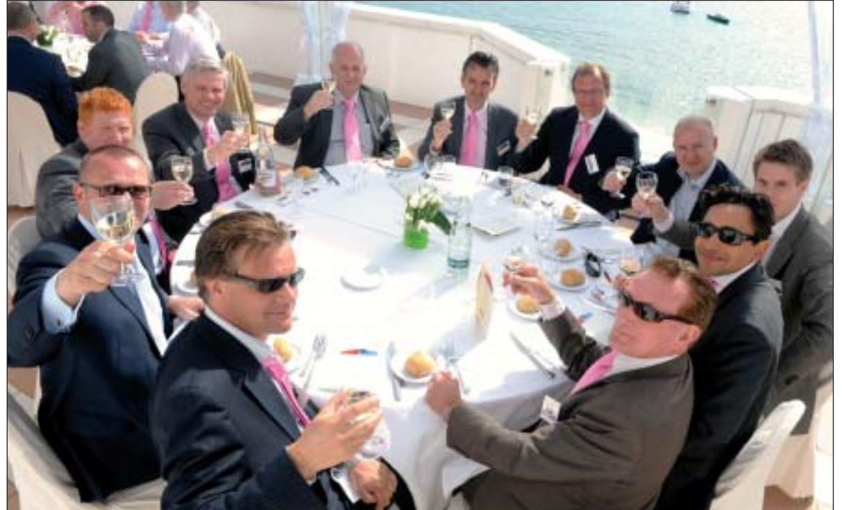
De Utrecht Lunch op het dak van het Palais Stephanie Hilton Hotel. De dassen dienden als entreebewijs. FOTO'S GUUS J. BAKS

Wat stond er op het menu van de Utrecht Lunch?