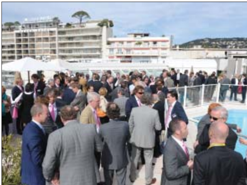
Volgens Van Riet en Associés was het de beste MIPIM in jaren