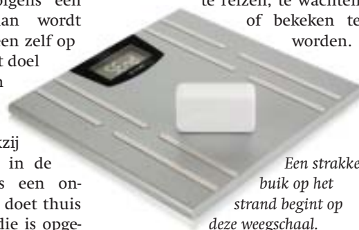
Een strakke buik op het strand begint op deze weegschaal.

nomen in een sportzaal. Zo ben je toch betrokken, maar hoeft je niet te reizen, te wachten of bekeken te worden.